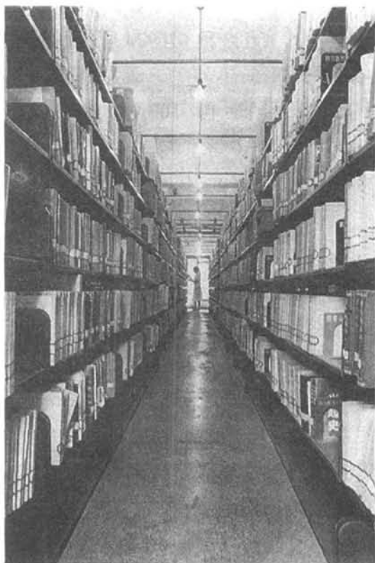
四川省图书馆书库之一角

集图书。1949年12月底清理旧有藏书,单以书刊计为89624册,另有其他文献若干。