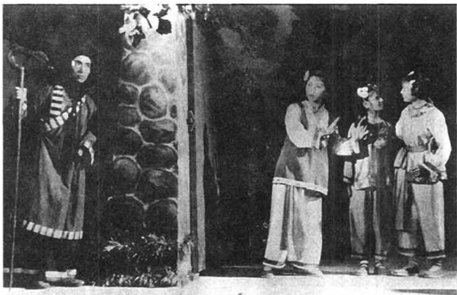
1953年,西南人民艺术剧院歌舞剧团演出歌剧《果园姐妹》