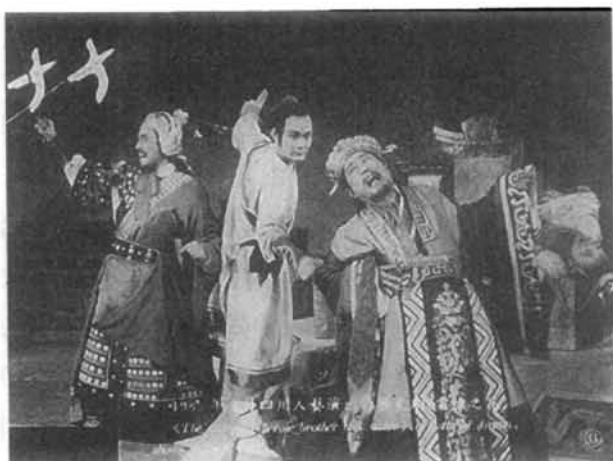
1985年,四川人民艺术剧院演出历史剧《棠棣之花》