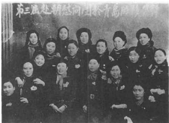
第三次赴朝慰问团中的川剧女演员