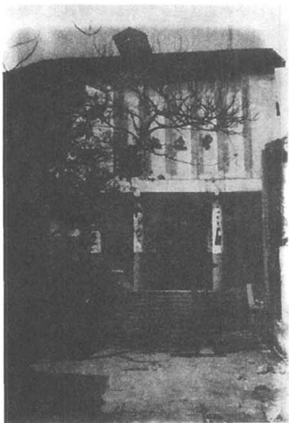
抗日战争时期重庆戏剧演出场所之 —抗建堂门景