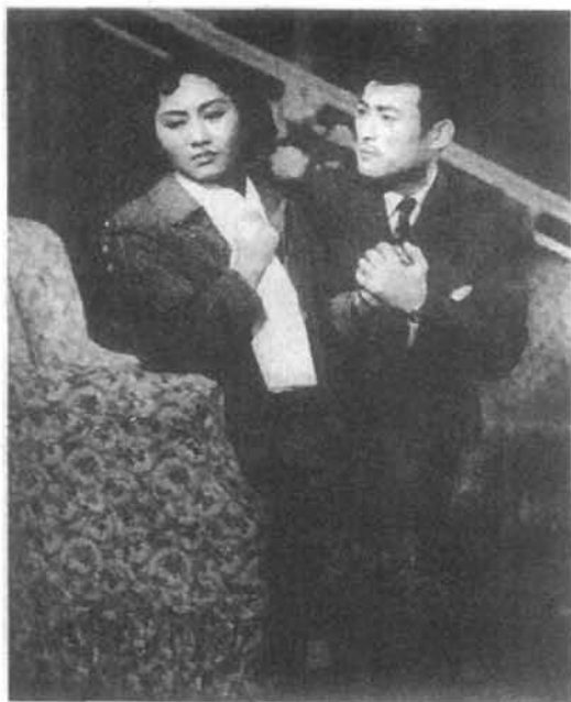
1962年,重庆市话剧团演出话剧《雾重庆》

重庆》、《胆剑篇》、《霓虹灯下的哨兵》、《年青的一代》、《转折》、《西安事变》、《陈