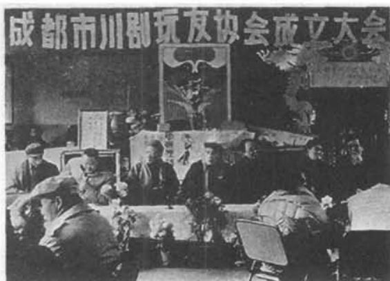
1987 年 12 月 16 日,成都市川剧玩友协会在锦江剧场成立。