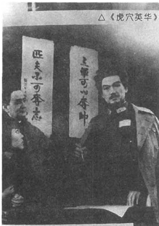
1979年重庆市话剧团演出话剧《虎穴英华》

近年来,该团还摄制了《硝烟尽处》、《百万酒案》、《C3计划》、《解放重庆》等十余部电视剧,配音复制了《歹徒》、《火山的灾难》等10余部外国影视片。