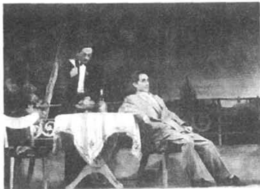
1953年,重庆市话剧团演出话剧《尤利斯·伏契克》