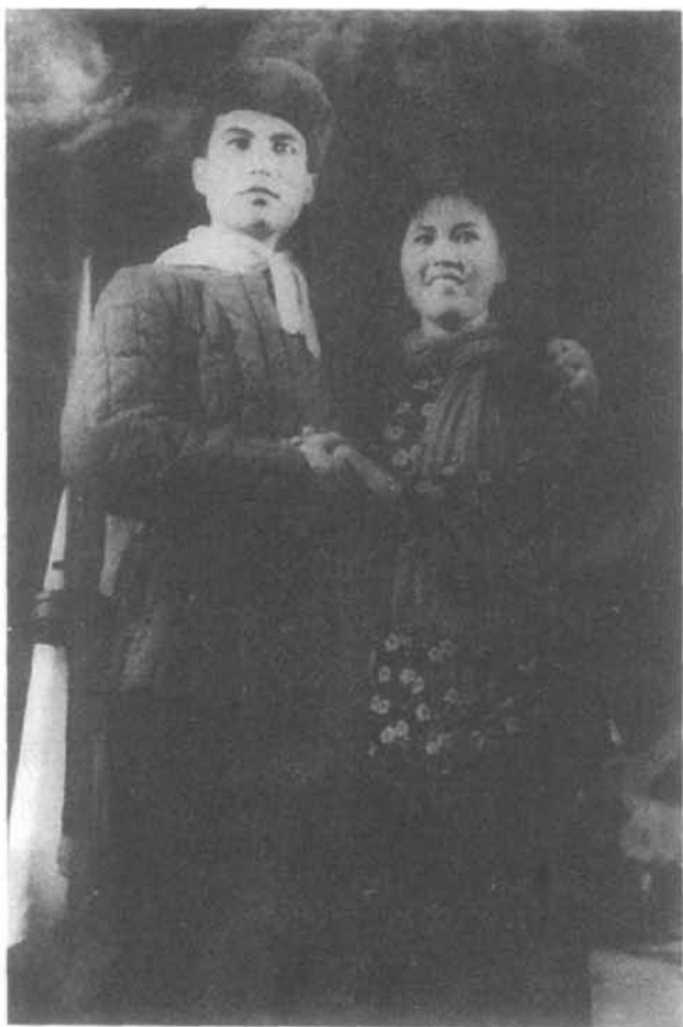
1954年,西南人民艺术剧院演出歌剧《一个志愿军的未婚妻》

姐》等,并创作、改编、移植演出大型歌剧《小女婿》、《一个志愿军的未婚妻》、《江姐》、《红云崖》、《火把节》等30多部,在国内影响较大。