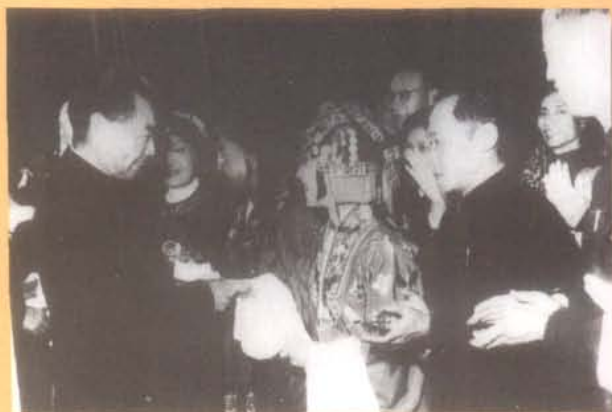
50年代，周恩来总理接见川剧《乔老爷奇遇》的演员