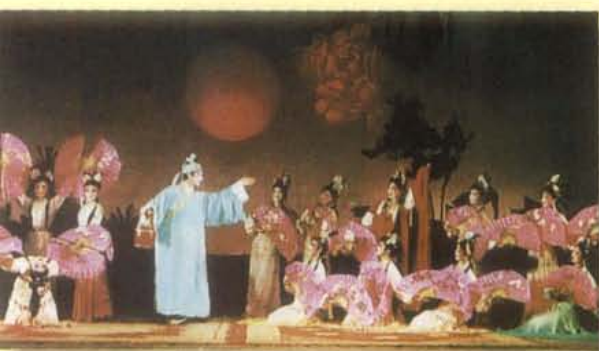
新都县川剧团演出的《芙蓉花仙》