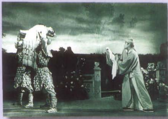
1956年10月，四川人民艺术剧院歌 舞团创作演出神话舞剧《芙蓉花》