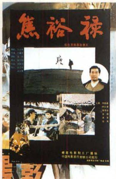
被电影局称为“1990年中国电影扛鼎之作”的影片《焦裕禄》海报