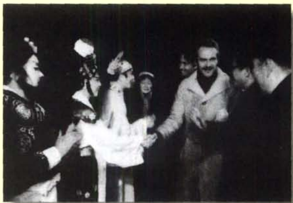
1985年6月，中国川剧演出团赴西柏林参加“八五地平线”艺术节