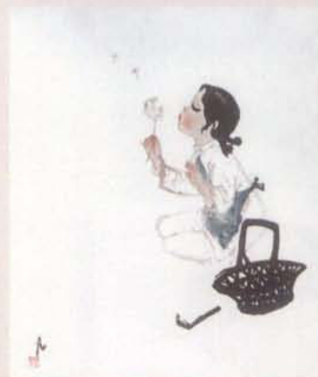
《蒲公英》，水印版画，1958年吴凡作。1959年获第七届世界青年和平友谊联欢节国际展二等奖、德国莱比锡国际版画比赛展金质奖