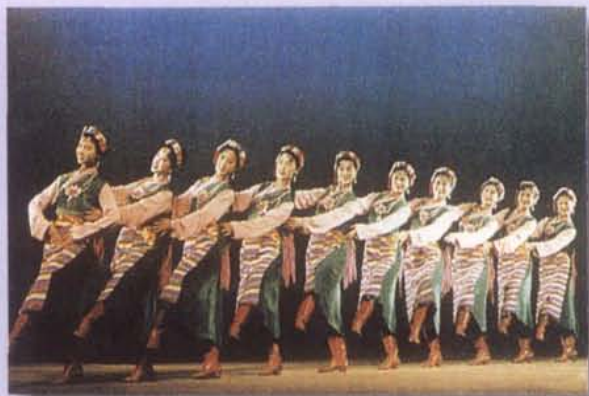
1979年，四川省歌舞剧院创作 演出的藏族舞蹈《康巴的春天》