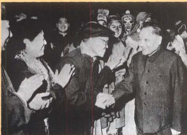
1983年10月，中央军委副主席邓小平（右一）观 看四川省振兴川剧赴京汇报演出团演出后，上台接见 阳友鹤（右二）、杨淑英（左二）、周裕祥（左一） 等演职员