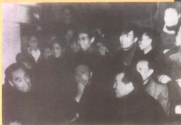
1957年2月11日，国务院总理周恩来观看重庆市话剧团演出话剧《日出》后与演职人员亲切交谈。前排左起周总理、省委书记李井泉、《日出》导演赵铨