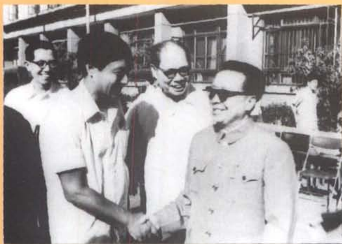
1980年6月，在四川省第二次文代会 上省委书记谭启龙接见作家克非