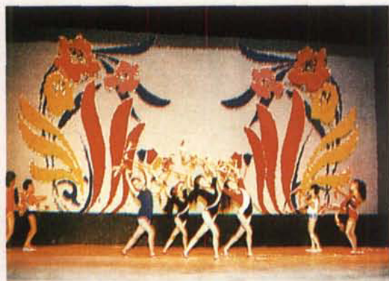
四川省群众艺术馆少儿歌舞《连箱》在1989年9月中国第二届艺术节四川分会场上大受欢迎