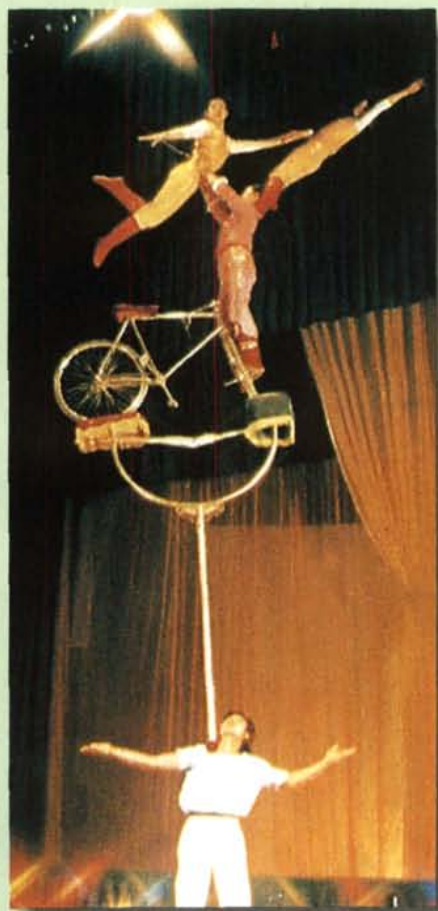
自贡市杂技团演出《扛定车》