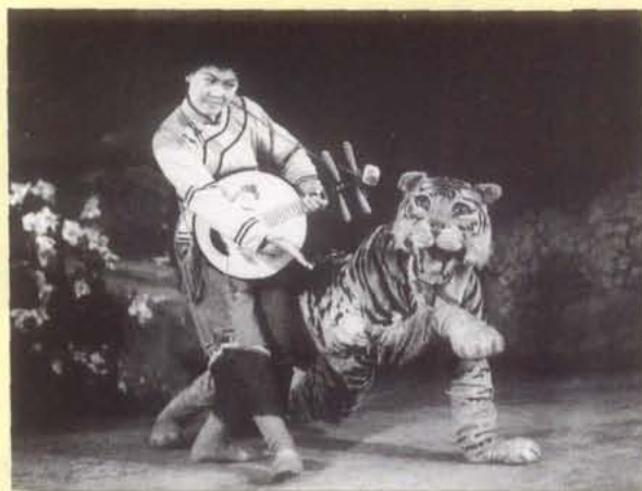
1982年，四川人民艺术剧院儿童剧团演出 《月琴与小老虎》，1983年获全国优秀剧目奖， 四川省优秀剧作一等奖