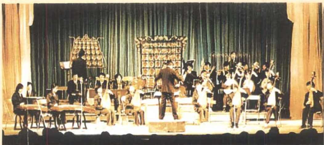
四川音乐学院民乐队