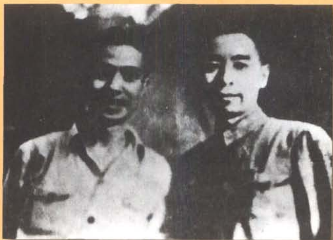
1942年，周恩来和阳翰笙于重庆赖家桥合影