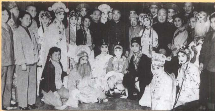
50年代，朱德、陈毅、郭沫若 等国家领导人接见川剧演员