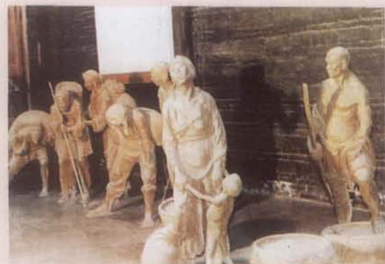
泥塑《收租院》艺术群局部