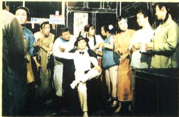
1988年，四川电视台与成都市川剧院合拍的电视剧《四川好人》