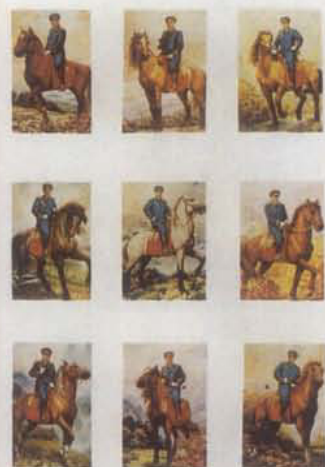
《九大元帅》，雷文彬等作。1984年获全国第六届美展金牌奖