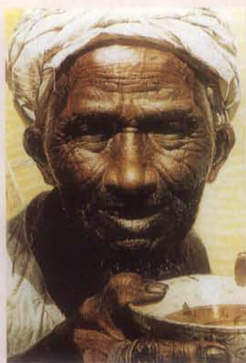
油画《父亲》，罗中立作。多次参加国内外美展获多种奖项