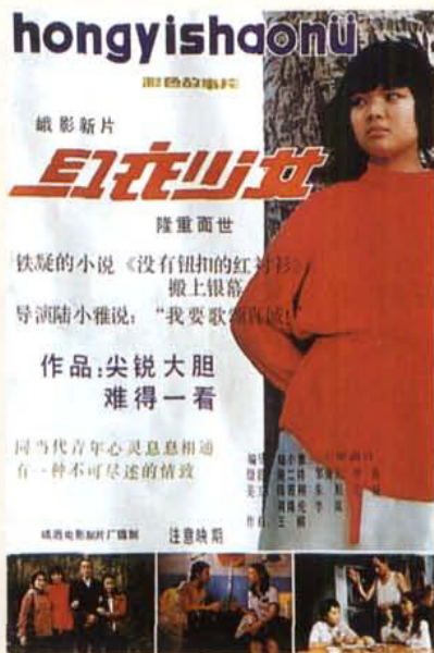
「政府奖」的影片《金鸡奖》、「百花奖」、「政府奖」的影片《红衣少女》电影海报