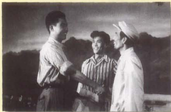
1956年，四川人民艺术剧院演出话剧 《一个木工》，荣获全国第一届话剧会演 创作、导演、表演、演出、舞美多项奖