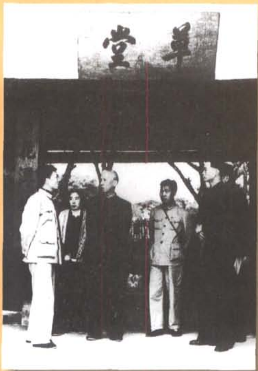
1958年4月，全国人大委员长刘少奇和夫人王光美参观草堂