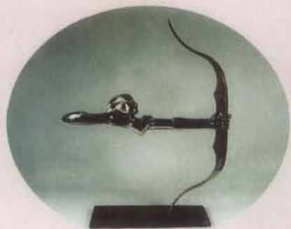
《千钧一箭》，雕塑，朱成作。1985年获第一届中国体育美术作品展览特等奖