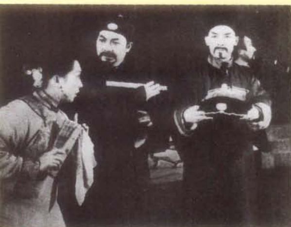
自贡市川剧团演出《巴山秀才》