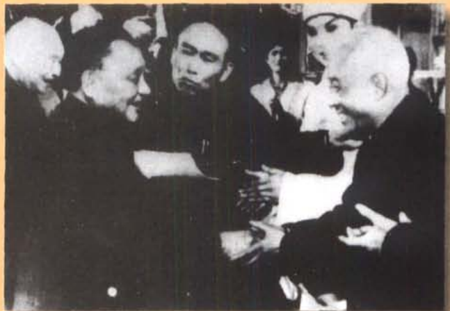
1983年9月10日，邓小平副主席接见“振兴川剧 赴京汇报演出团”时会见川剧名鼓师苏鸣清