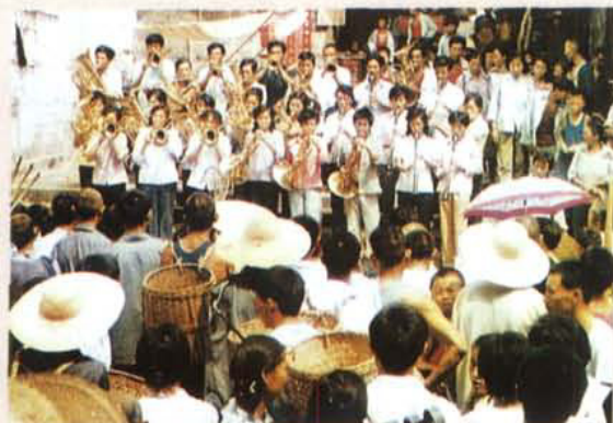
威远镇西农民铜管乐队名扬海内外