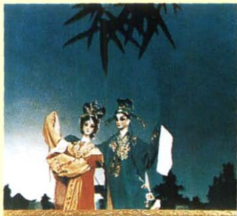
成都木偶皮影艺术剧院演出中杖头木偶剧《秋夜别离》