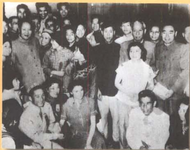
1959年9月，党和国家领导人毛泽东、刘少奇、周恩来接见参加中国新民主主义青年团第三次全国代表大会的各族代表。刘少奇前站立者为成都川剧演员周学如