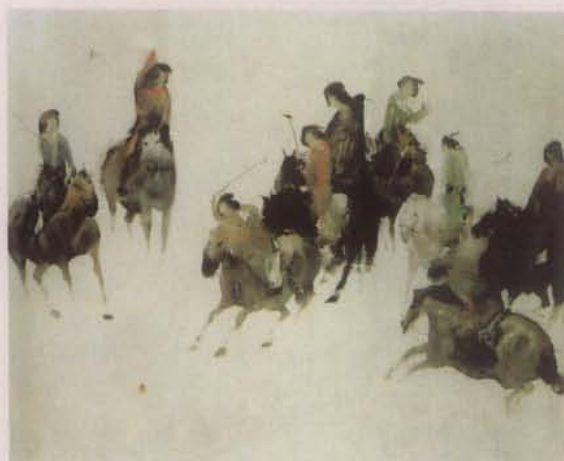
《打马球》，彭先诚作。1990年在十一届亚运会全国体育美展上获一等奖