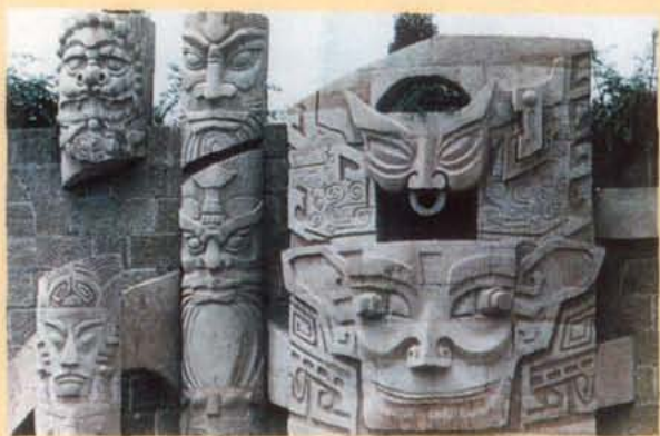
德阳市艺术墙浮雕《智慧之光》