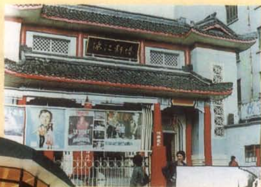
80年代锦江剧场外貌