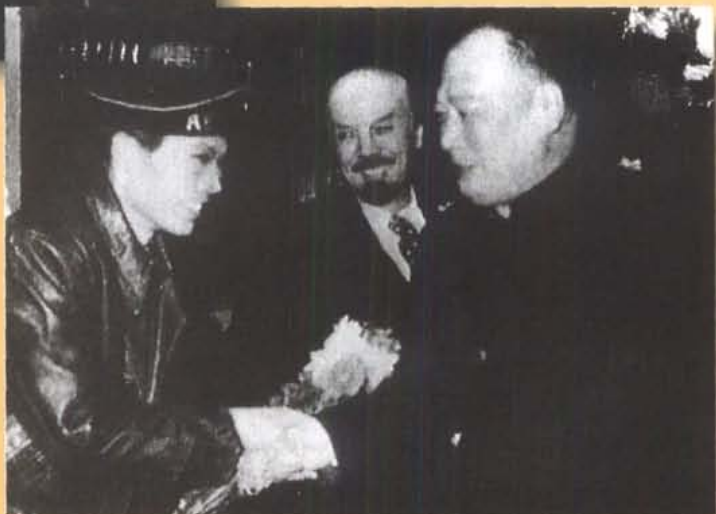
1959年10月，陈毅副总理与《克里姆林宫的钟声》演员刘莲池、田园亲切交谈