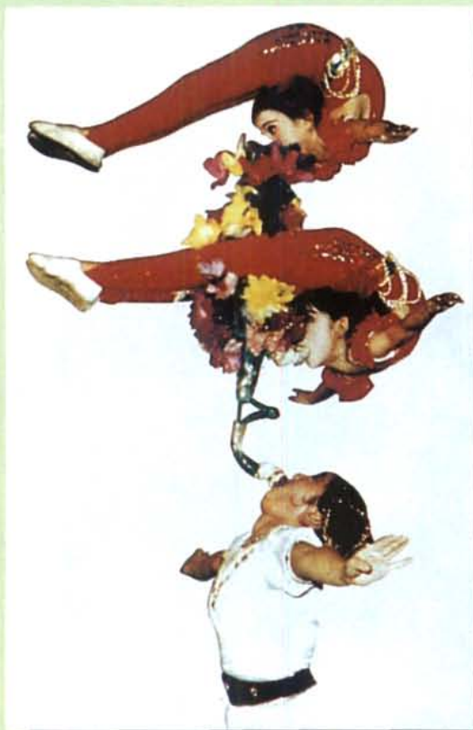
资阳县杂技团演出《双层对口含花》