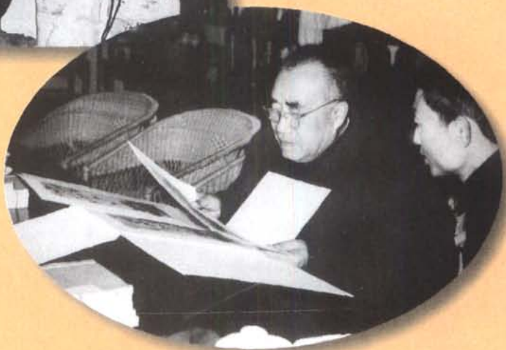
1960年4月，朱德委员长参观 草堂时，欣赏杜甫诗意画册