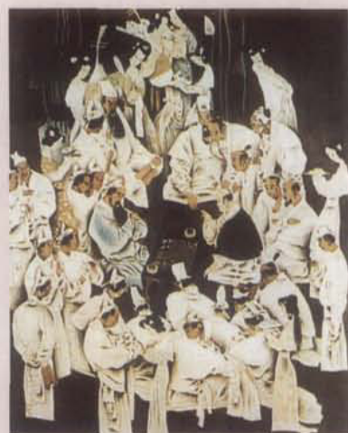
中国画《竞技图》，吴绪经作。获第十一届亚运会体育美展暨第二届全国体育美展特等奖