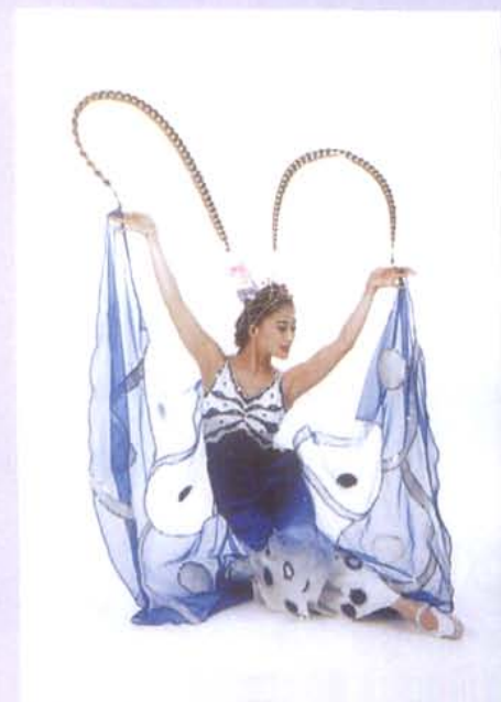
1983年，四川省歌舞剧院演出舞蹈《蝶恋花》