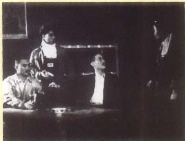
1953年，重庆市话剧团演出《四十年来的愿望》 1956年荣获全国第一届话剧会演创作、导演、表演、 舞美、演出多项奖