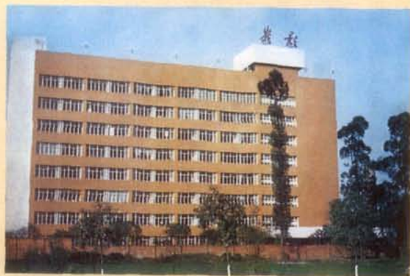
峨眉电影制片厂主楼