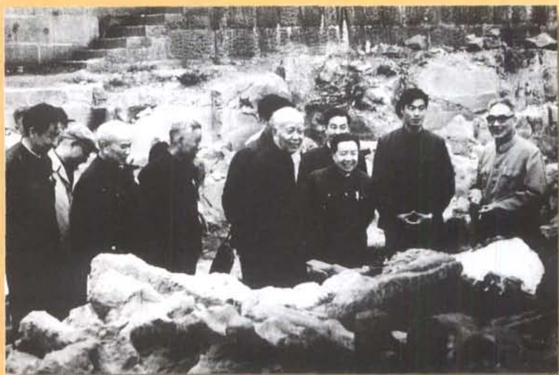
1984年4月10日，国务院副总理万里（右四）在自贡大山铺恐龙化石发掘现场视察