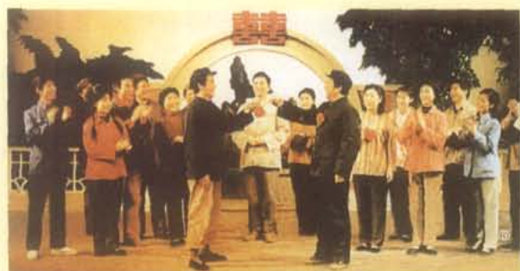
1981年2月，四川人民艺术剧院演出话剧 《赵钱孙李》，1982年获文化部颁发优秀剧 目奖，四川省优秀剧作一等奖