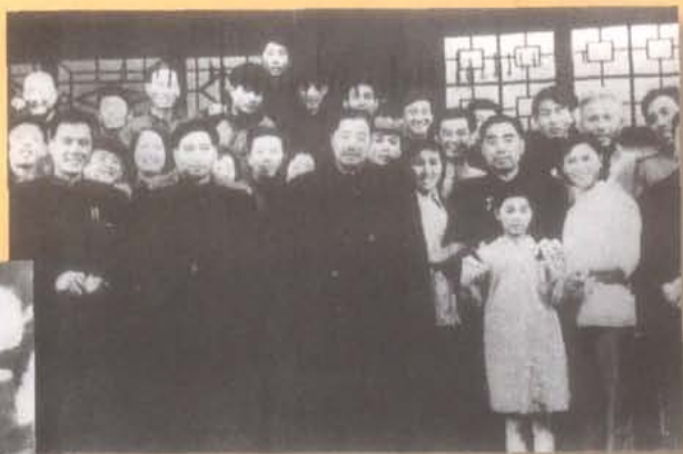
1957年2月10日，国务院总理周恩来、副总理贺龙与四川人民艺术剧院《同甘共苦》剧组演职员在一起