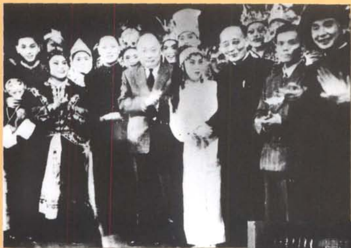
50年代，陈毅副总理、郭沫若院长等在京接见川剧演员