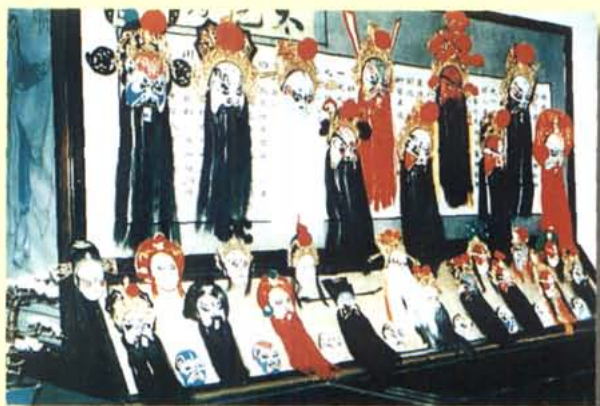
陈列于成都市川剧艺术陈列馆中的川剧脸谱及民间戏剧工艺品