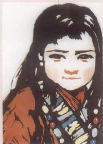
《藏族女孩》，1958年李焕民作。日本中日艺术研究会授予金质奖