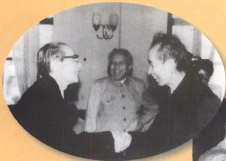
1965年6月，夏衍与 艾芜、何郝炬亲切交谈