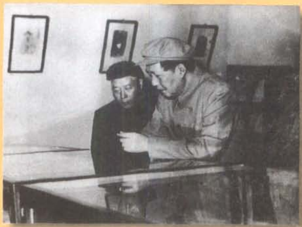
1958年3月，毛泽东主席参观草堂陈列室。左为省委书记李井泉