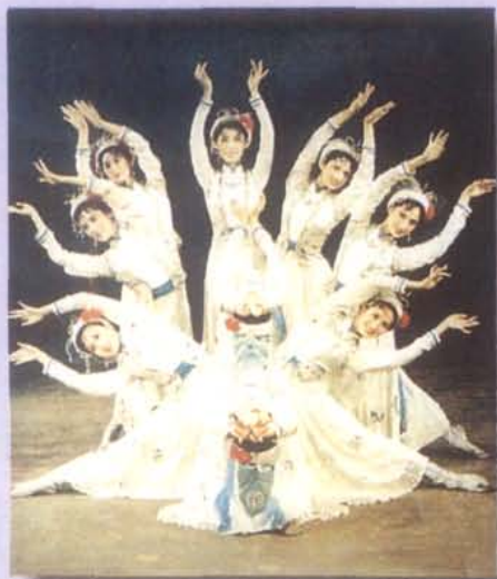
1982年，四川省歌舞剧院 演出羌族舞蹈《百合花》