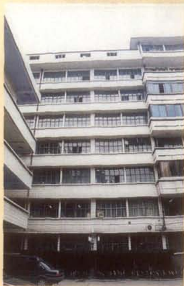
1986年新修的四川省 文联办公大楼一角