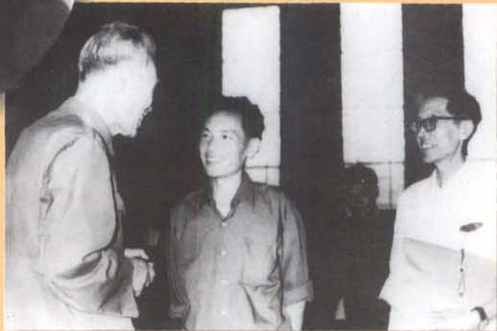
1980年，在四川省第二次文代会上 省委副书记杜心源接见作家周克芹