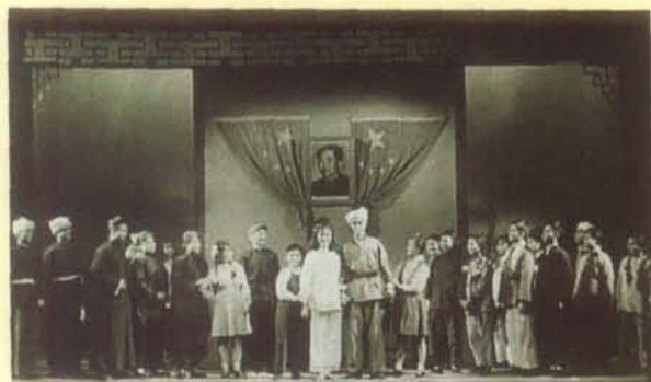
1953年，西南人民艺术剧院 歌舞剧团演出歌剧《小女婿》