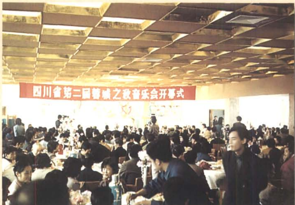
1984年10月17至31日，第二届蓉城之秋音乐会开幕式