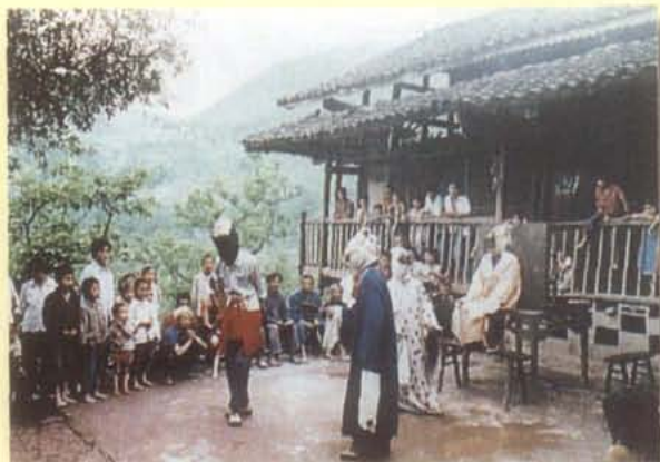
酉阳土家族苗族自治县铜西乡文化站的 傩戏班子在山寨院坝为村民演出