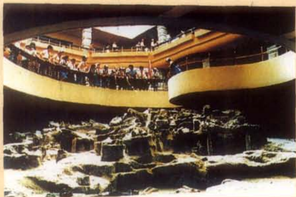
自贡恐龙博物馆恐龙化石遗址场景