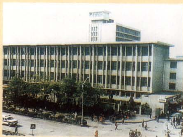
四川省图书馆阅览楼