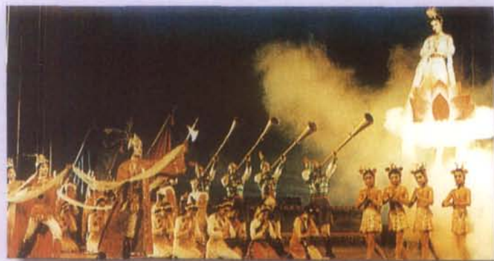
1980年，成都音乐舞剧院演出藏族舞剧《卓瓦桑姆》