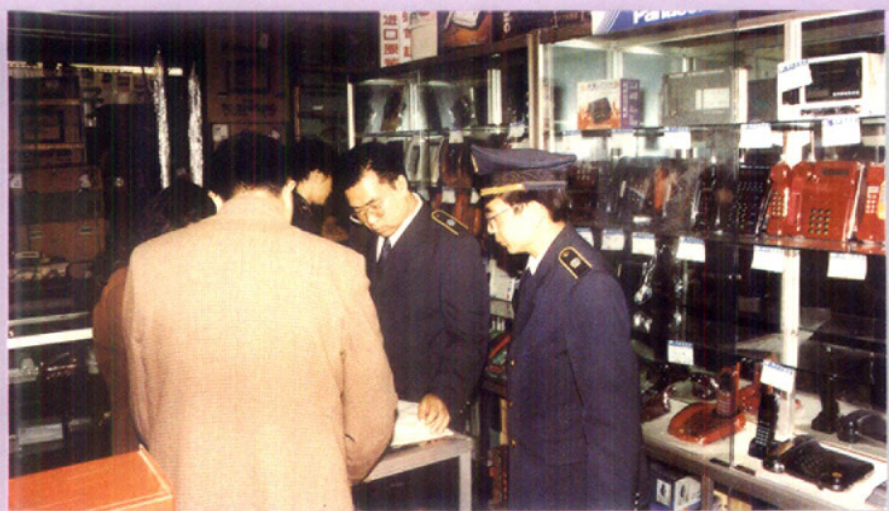
加强流通领域进口家电检验监督管理