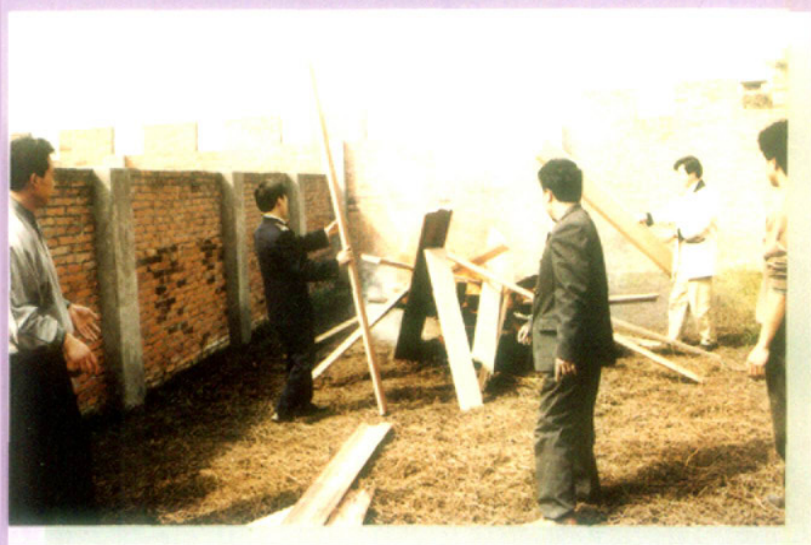
销毁检验不合格的进口木制品