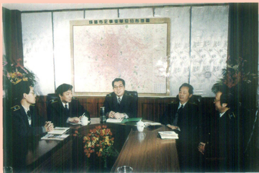
四川商检局党组工作扩大会议研究商检工作