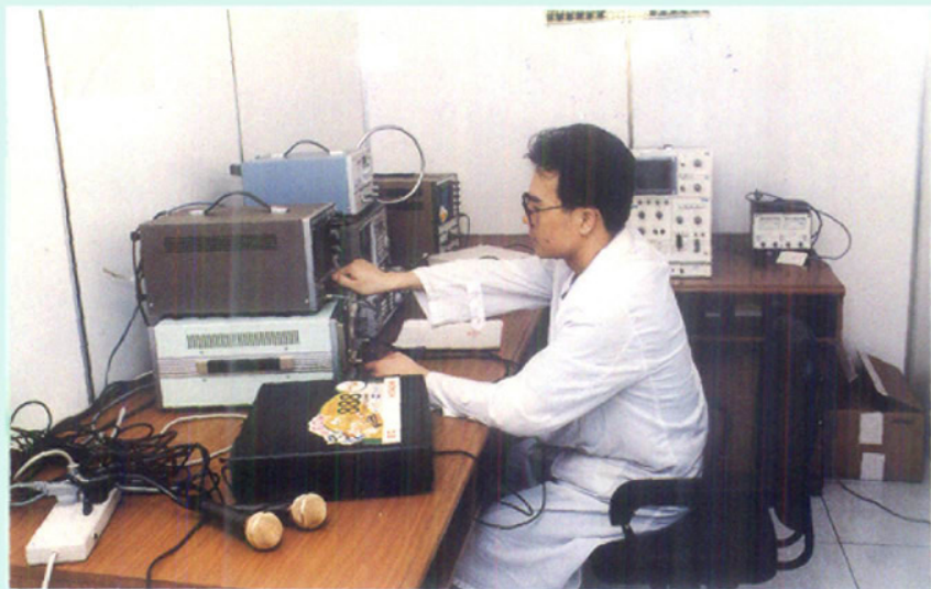
家用电器性能检验