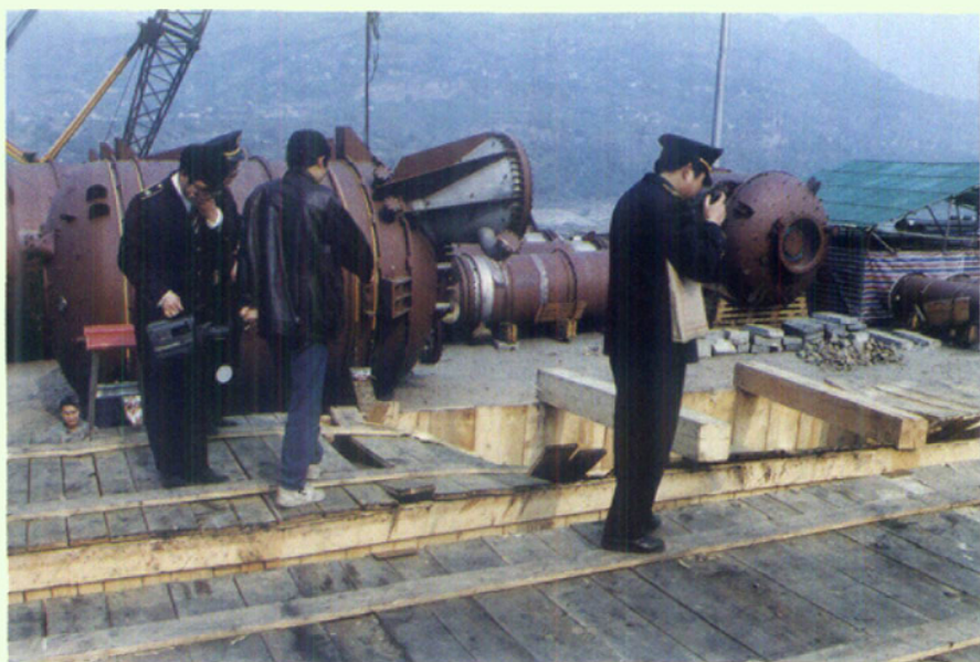
进口设备开箱前取证