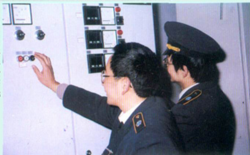
检测进口涤纶长丝生产线