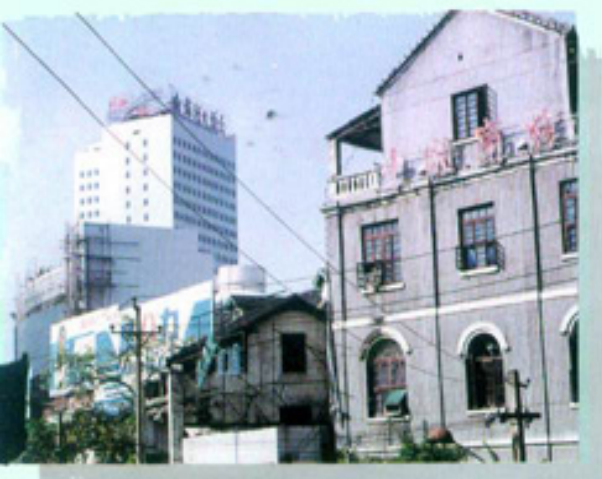
1949年前四川商检机关办公大楼