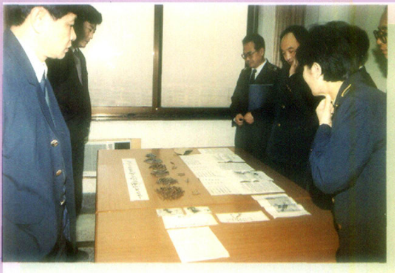
查出掺入松茸的铁丁等实物