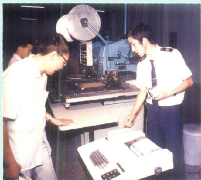
录像机生产线检验