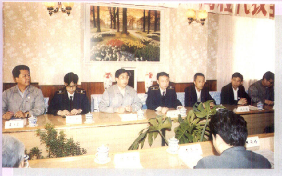
加强对出口企业监督管理