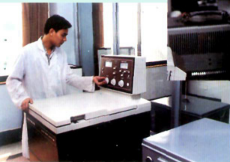
高速冷冻离心机檢驗