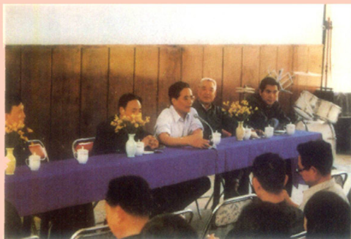
1986年4月，国家商检局局长王久安（中）来局视察在全体职工大会上讲话