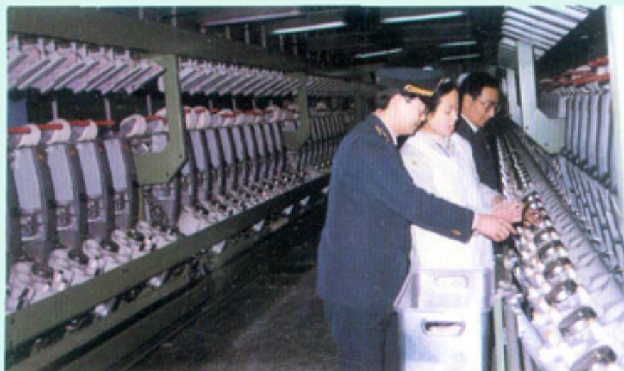
现场检测进口络筒机