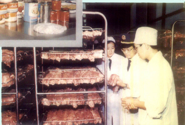
出口动物产品检疫