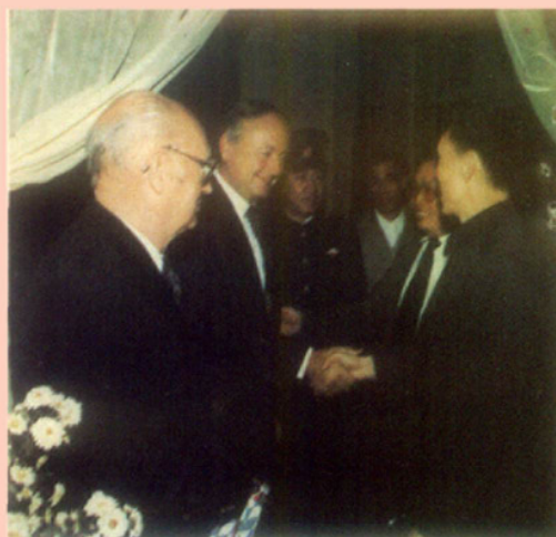
1984年11月1日，副局长蒋爵培会见西德联邦卫生局研究所前任主任格罗斯·克劳斯和斯坦白策切尔博士