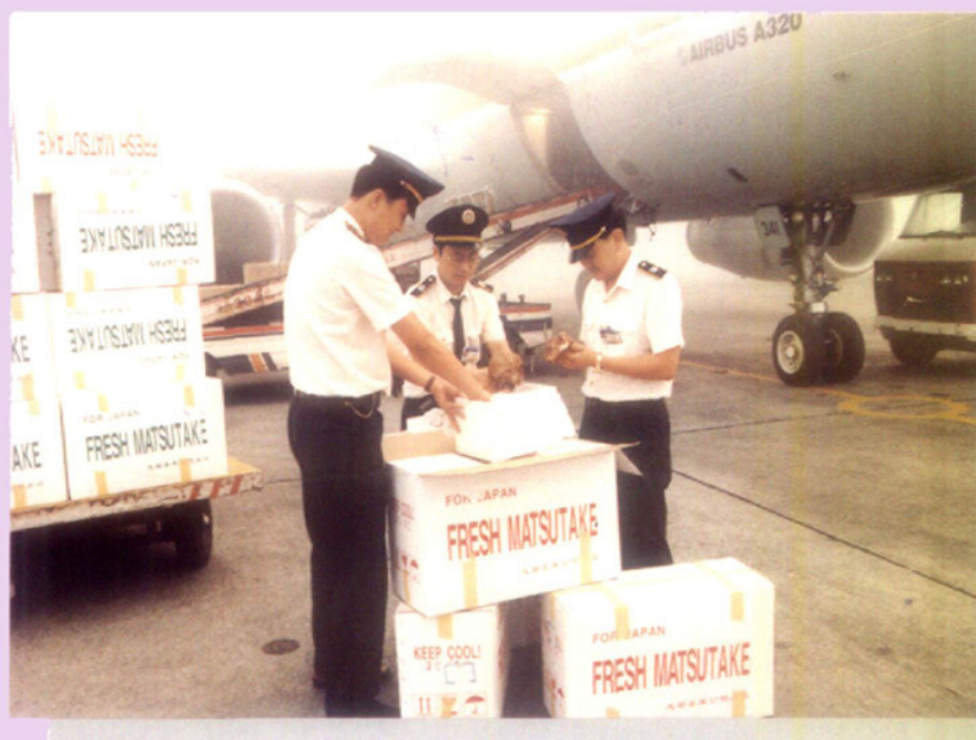
航空港查验出口鲜松茸