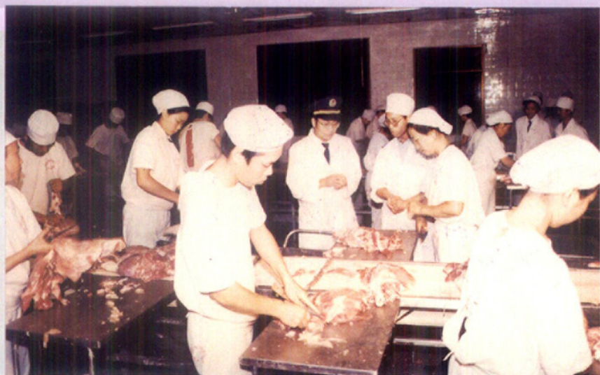
对出口商品实施监督管理