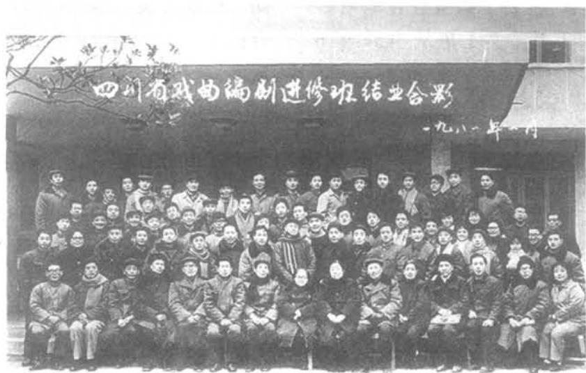
四川省戏曲编剧进修班结业合影

四川省戏曲编剧进修班 1981~1986年,由省文化局艺术处及直属剧目工作室主办的四川省戏曲编剧进修班共6期,学习人员250余名(包括川剧和其他剧种),旨在对各专业戏曲剧团中的专业编剧和兼职编剧,轮流培训,以提高编剧才能。该班学员所创作、改编的剧本,共有大、中、小型200余个。迄至1990年,